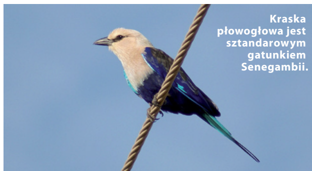
Kraska płowogłowa jest sztandarowym gatunkiem Senegambii.

Kraski są doskonałymi lotnikami, co uwidacznia się szczególnie podczas lotów tokowych, kiedy wykonują w powietrzu niezwykle akrobacje. Są ptakami ciepłolubnymi, większość preferuje tereny otwarte – stepy, sawanny, lasostepy lub pola poprzedzielane zadrzewieniami. Tylko niektóre zamieszkują lasy lub ich obrzeża. Najlepszym miejscem do ich obserwacji są afrykańskie sawanny, gdzie występuje aż 7 gatunków krasków. Na przykład w Gambii (Afryka Zachodnia) obok przepięknej kraski płowogłowej ( Coracias cyanogaster ), możemy zaobserwować kraskę liliowopierśną ( C. caudatus ), kreskowaną ( C. naevius ), zimującą tam kraskę zwyczajną ( C. garrulus ) i na dodatek bardzo podobną do niej, jednak charakteryzującą się wydłużonym ogonem kraskę abisyńską ( C. abyssinicus ).