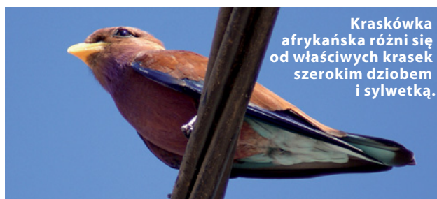
Kraskówka afrykańska różni się od właściwych krasków szerokim dziobem i sylwetką.