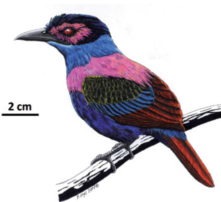
Przypuszczalny wygląd drzymokraski ( Primobucco mcgrewi ) z eocenu Green River, USA.

Początki krasiek sięgają przynajmniej 54–48 Ma i epoki zwanej eocenem. Był to okres znacznie cieplejszy niż obecnie – przynajmniej do 50°N (czyli do szerokości geograficznej, na której leżą dziś Kraków, Lwów czy Kijów) Europę porastały wilgotne lasy tropikalne. W takim właśnie środowisku żyły pierwsze kraski, a znamy je dzięki dwóm oknom na tamtejszy świat: osadom formacji skalnej Green River (Wyoming, USA), liczącym 53,5–48,5 Ma, oraz kopalni Messel (Niemcy) z pokładami datowanymi na ok. 47 Ma.