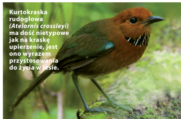
Kurtokraska rudogłowa ( Atelornis crossleyi ) ma dość nietypowe jak na kraskę upierzenie, jest ono wyrazem przystosowania do życia w lesie.

Blisko spokrewniona z kraskami rodzina ziemnokrasek (Brachyptaraciidae) obejmuje obecnie 5 mało znanych gatunków żyjących jedynie na Madagaskarze. Ziemnokraski różnią się od krasek mocniejszymi i dłuższymi nogami,