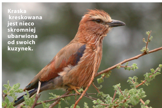
Kraska kreskowana jest nieco skromniej ubarwiona od swoich kuzynek.