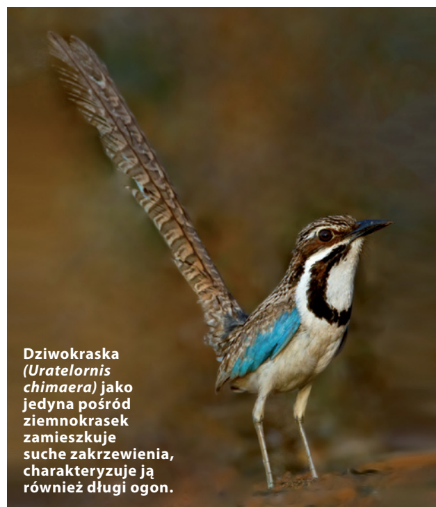
Dziwokraska ( Uratelornis chimaera ) jako jedyna spośród ziemnokrasek zamieszkuje suche zakrzewienia, charakteryzuje ją również długi ogon.