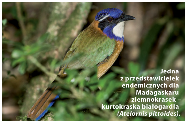
Jedną z przedstawicieli endemicznych dla Madagaskaru ziemnokrasek – kurtokraska białogardła ( Atelornis pittoides ).

Bliskimi kuzynkami krasek są należące do tej samej rodziny kraskówki. Co ciekawe, w języku angielskim nazywane są dollarbirds . Nazwa ta pochodzi od dużych jasnoniebie-