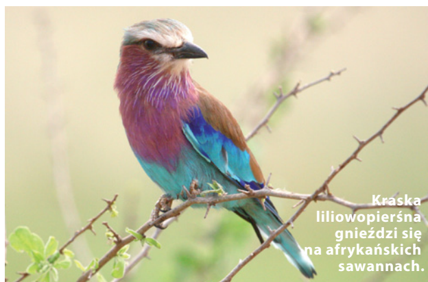
Kraska liliowopierśna gnieździ się na afrykańskich sawannach.